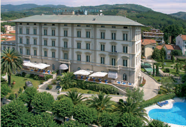
Grand Hotel Vittoria